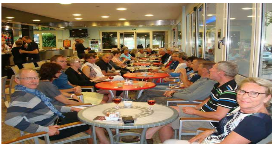
UNE AMBIANCE CONVIVIALE