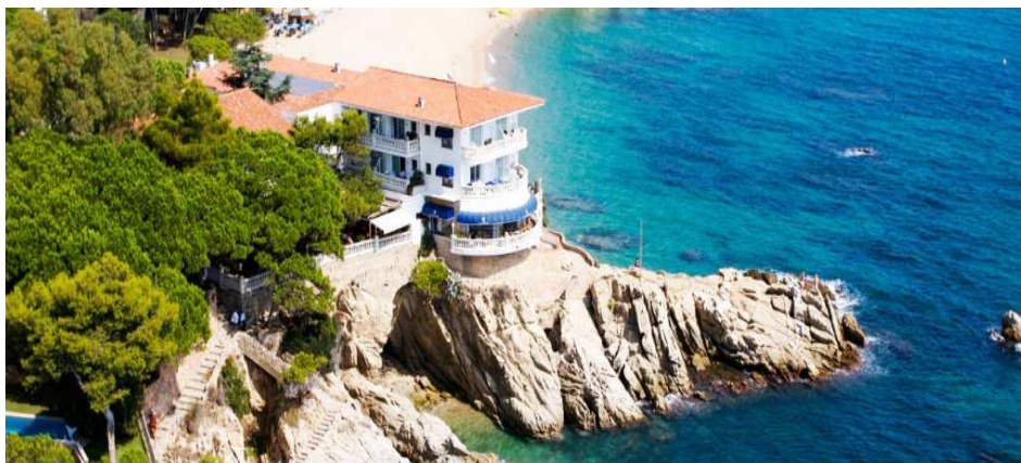
HOTEL COSTA BRAVA