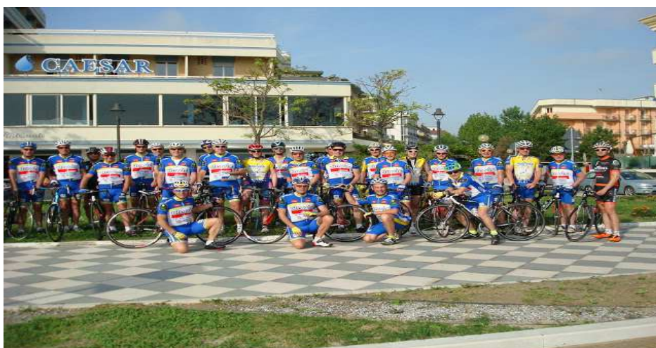
NOS CYCLISTES AU STAGE 2015